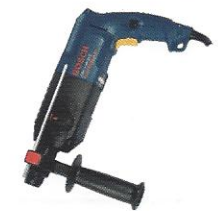
FURADEIRA DE 1/2 DE IMPACTO

informações técnicas no site: www.clicloc.com.br