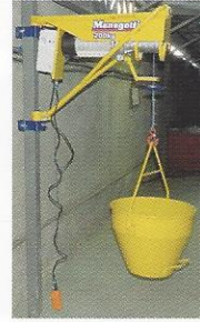
GUINCHO DE COLUNA