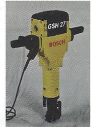
MARTELO DEMOLIDOR 30KG