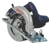
SERRA CIRCULAR 7" 1/4