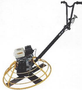
ACABADORA DE PISO