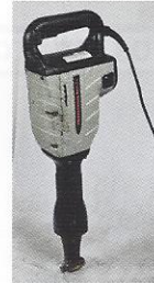
MARTELO DEMOLIDOR 20KG