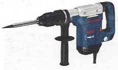
MARTELO DEMOLIDOR 5KG

LOCAÇÃO DE EQUIPAMENTOS PARA CONSTRUÇÃO CIVIL