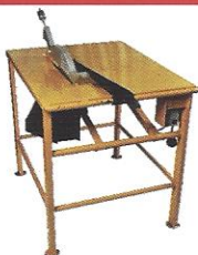
BANCADA DE SERRA