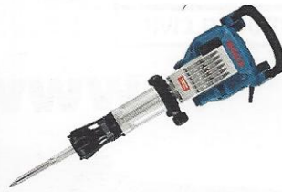
MARTELO DEMOLIDOR 16KG