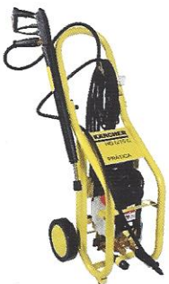
LAVADORA DE ALTA PRESSÃO