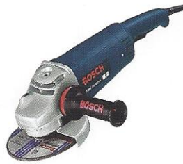
ESMERILHADEIRA LIXADEIRA 7"