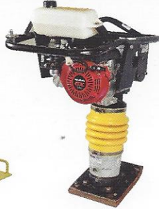
COMPACTADOR DE SOLO SAPO