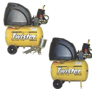
COMPRESSORES DE AR