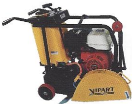
CORTADORA DE PISO