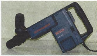
MARTELO DEMOLIDOR 10KG