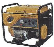
GERADOR DE ENERGIA