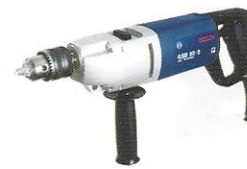
FURADEIRA DE IMPACTO GSB30